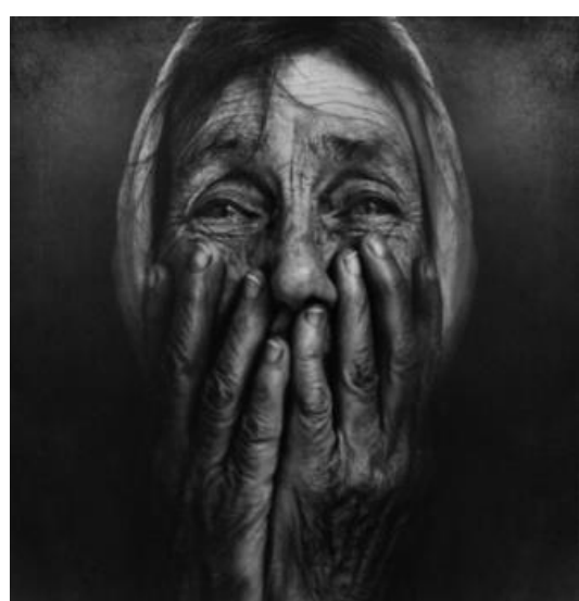
Lee Jeffries – Fotografia

imagens do fotógrafo britânico Lee Jeffries, que registra a vida de pessoas ignoradas pela sociedade. Antes de fazer as fotos, o artista se aproxima dos moradores de rua,