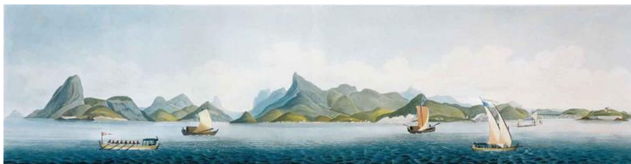
Henry Chamberlain – Vista do lado oeste do porto do Rio de Janeiro, 1822 – Água-tinta e aquarela sobre papel

Durante o período colonial, os artistas viajantes se aventuraram em registrar as belezas das paisagens brasileiras. Cada detalhe era minuciosamente traduzido em forma de desenho e aquarela. Como ainda não existia fotografia, os trabalhos desses artistas tiveram a importante missão de divulgar as características do Brasil às pessoas de diversas localidades, inclusive da Europa. Jean-Baptiste Debret, Henry Chamberlain e Johann Moritz Rugendas são exemplos desses artistas inquietos, que gostavam de conhecer lugares diferentes.