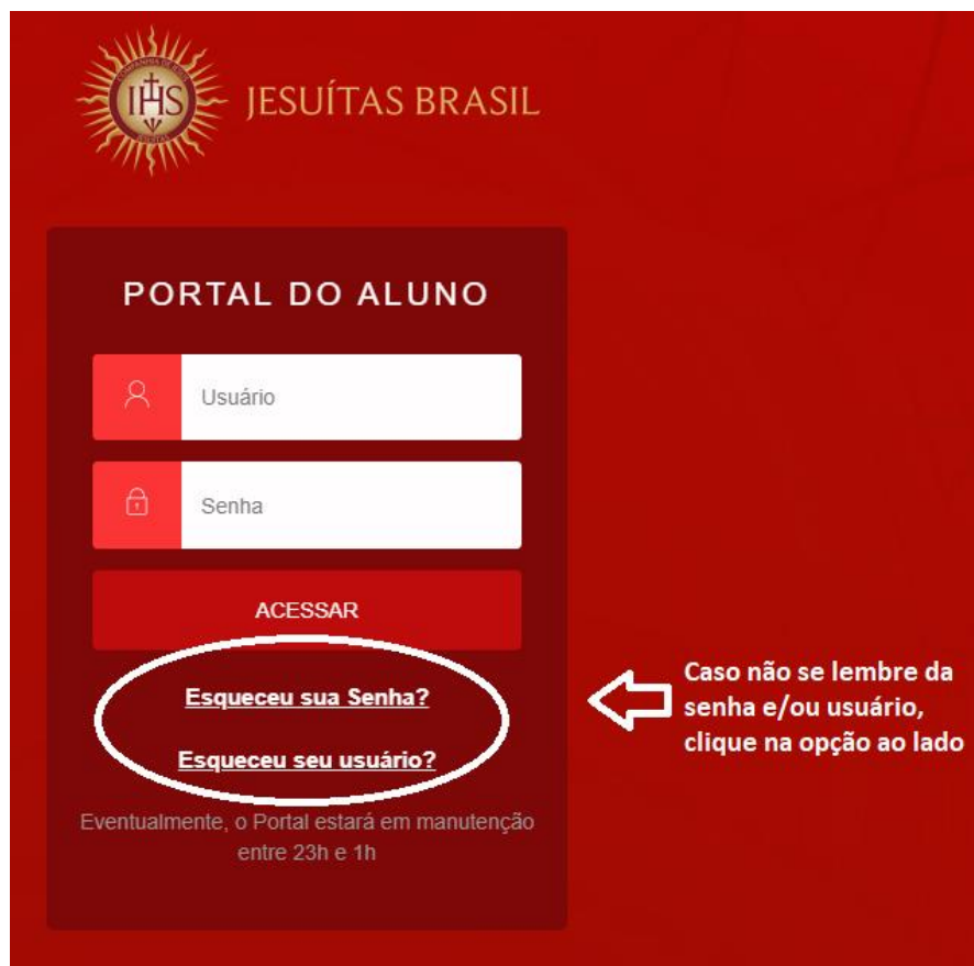
Tela Inicial do Portal Educacional

Caso você tenha esquecido sua senha ou usuário, clique em “Esqueceu sua senha?” ou “Esqueceu seu usuário?”, tal como mostrado na figura abaixo.