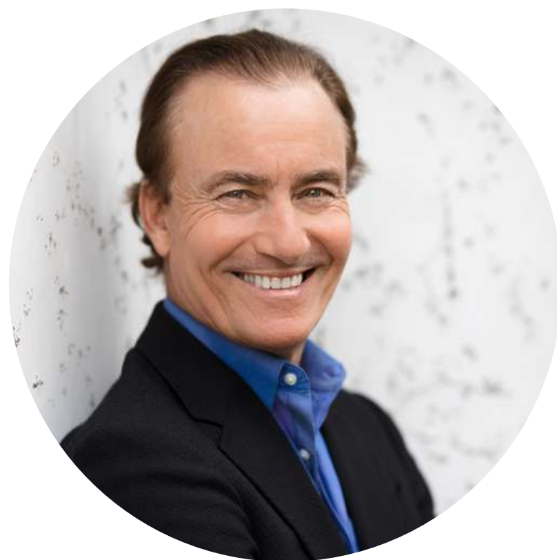
Trip Hawkins Fundador da EA Sports