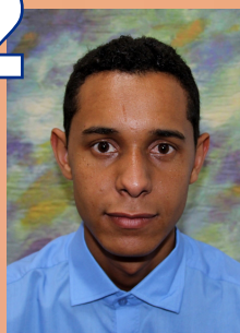
Rafael Guimarães Almoxarifado