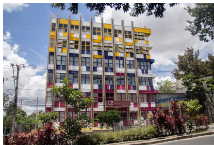
Prédio A – Pe. Agostinho Castejón, SJ