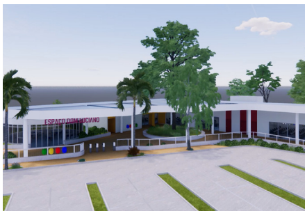
Prédio D - Dom Luciano Mendes, SJ