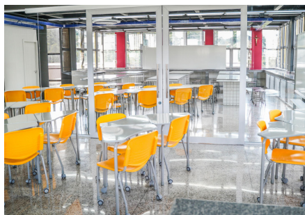
Prédio A – Laboratórios