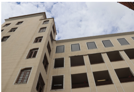
Prédio B - Pe. Pedro Arrupe, SJ