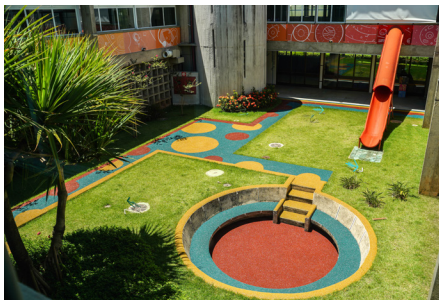
Prédio E - Espaço Pe. Kolvenbach, SJ.