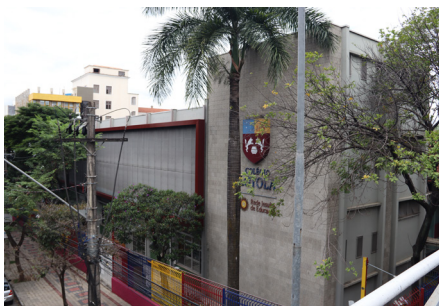
Prédio C - Pe. Francisco Rigolin, SJ